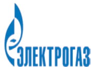
АО "Газпром электрогаз« г. Москва